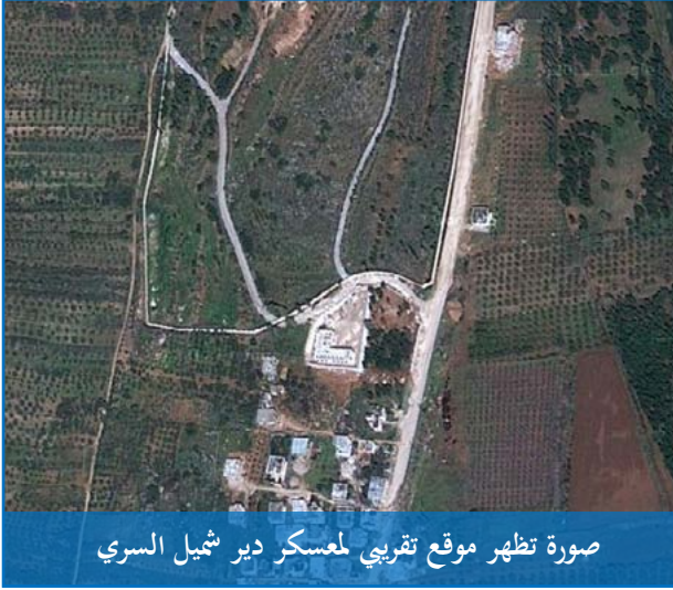
صورة تظهر موقع تقريبي لمعسكر دير شمبل السري

الموقع والمنشأ: يقع معسكر دير شمبل في الريف الشمالي الغربي لمحافظة حماة، في شمال مدينة مصياف على بعد قرابة ٢٠ كيلو متراً، تُقدر مساحة هذا المعسكر بنحو ١٨٠ دونماً.